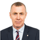
Adam Price AS Plaid Cymru

Roedd yr Aelod a ganlyn hefyd yn aelod o'r Pwyllgor yn ystod yr ymchwiliad hwn.