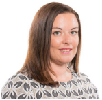
Vikki Howells AS Llafur Cymru